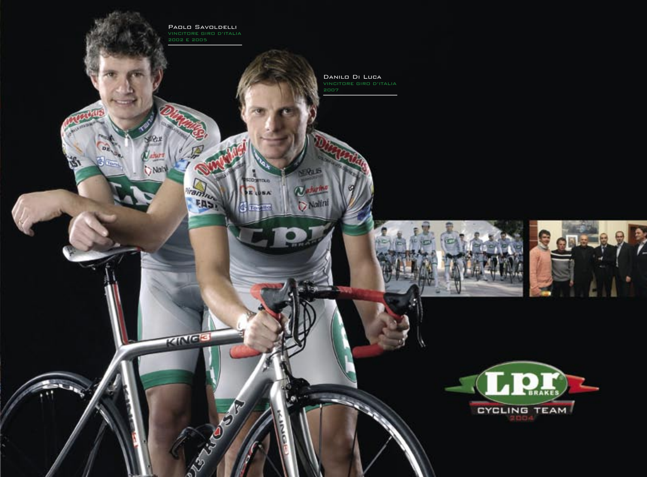
DANILO DI LUCA VINCITORE GIRO D'ITALIA 2007